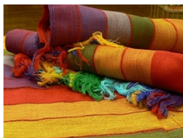
Sciarpe della pace