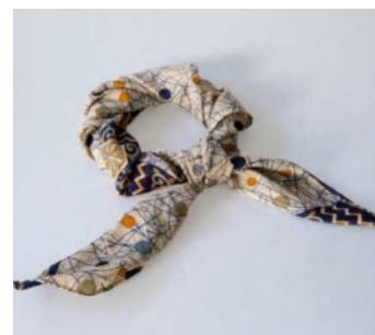
Foulard in seta