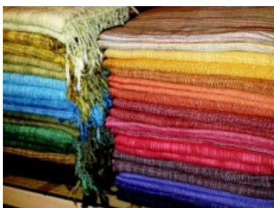
Sciarpe in cotone

Nell'assortimento si possono scegliere sciarpe in cotone, in seta, in seta e cotone, in seta e lino. Altro: stole, foulard, pareo, bandana, fazzoletti, borse, bomboniere ed accessori vari. Le buste e le scatoline per il confezionamento sono realizzate in cartone 100% ecologico.