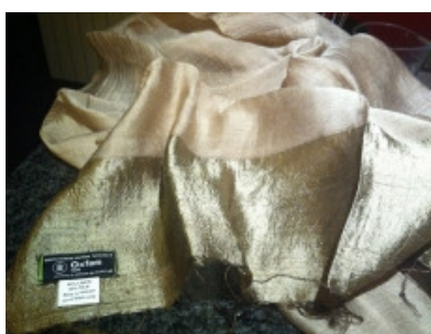
Sciarpe in seta e lino