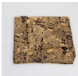
Fazzoletti in seta