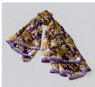
Pareo in seta