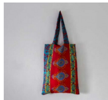
Shopper in fibra mista