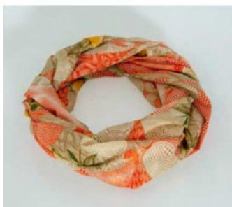
Stola LOOP in seta