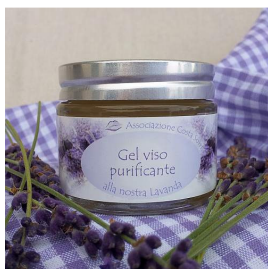
Gel viso purificante

Lavanda ed aloe levigano la pelle distendendo le piccole rughe. Idrata e ristruttura la pelle donando al viso un aspetto più disteso e luminoso.