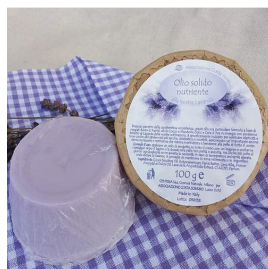
Olio solido emolliente

Le proprietà emollienti, lenitive ed antinfiammatorie rendono questo olio ottimo per massaggi contro dolori muscolari ed articolari. Utile contro piccole scottature, escoriazioni e punture di insetti. E' un cicatrizzante naturale.