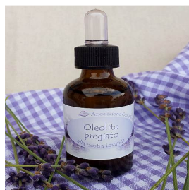
Oleolito alla lavanda

Gel a base di lavanda, genziana e bardana ad azione antilucido, dermopurificante, astringente e sebo equilibrante. Adatto per pelli impure, agisce contro l'acne giovanile ed i punti neri.