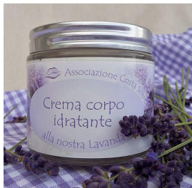
Crema corpo idratante

Morbida schiuma ad azione fitocosmetica e aromaterapica esercita un'azione nutriente, tonificante, purificante ed elasticizzante. Il bagno risulta particolarmente rilassante grazie alle proprietà calmanti della lavanda.